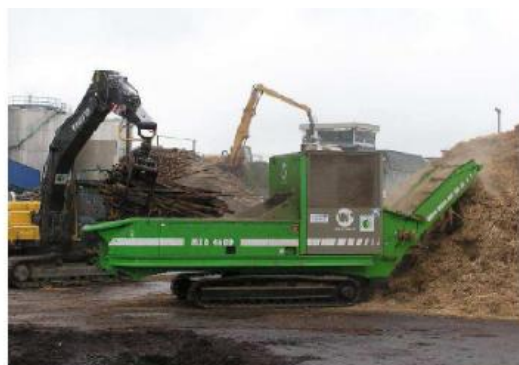
Figura 4 - Estilhaçamento com facas, à esquerda e trituração com equipamento de martelos, à direita

Tipicamente um estilhador pode tratar restos de ramos e bicadas ou mesmo toros de madeira queimada, reduzindo-os a fragmentos com dimensões máximas de 30x10x10 cm. Com estas dimensões já é possível obter uma maior densidade para transporte; a título de exemplo com 40% de humidade podemos referir que um camião de 80 m 3 de capacidade poderá transportar 17 a 20 ton de resíduos, ou seja, com densidade de 212-250 kg/m 3 de material destroçado, com dimensões abaixo dos 30 cm.