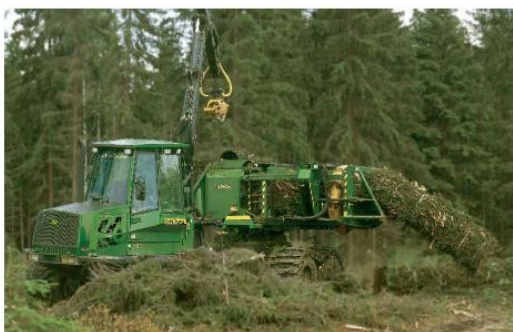
Figura 3 - Máquina de enfardar

Diminuir os espaços vazios é pois o objetivo essencial. No caso do enfardamento, o conjunto de ramas depois de compactado é amarrado, podendo ser manuseado e transportado como se tratasse de um toro, o que permite o uso de equipamento já existente na indústria da madeira.