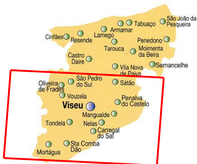
Figura 6 - Localização da área de estudo

A área de estudo localiza-se no distrito de Viseu (figura 6), concelhos de Mortágua e Mangualde. A escolha deste local deve-se à quantidade de biomassa agrícola e florestal existente na região e à facilidade de acessos.