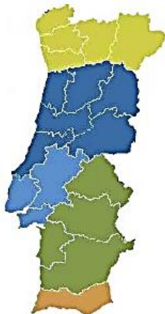
Figura 1 - Divisão de Portugal Continental por NUT II