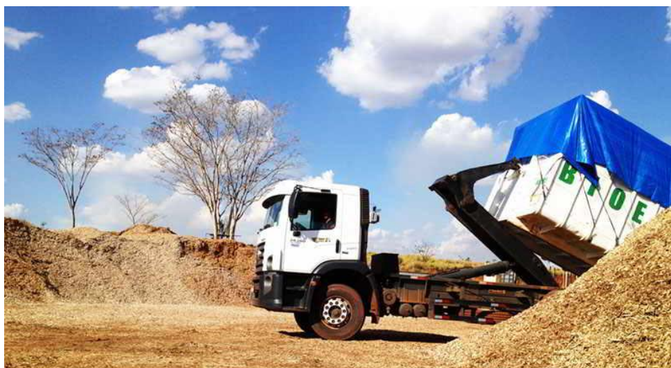
Figura 5 - Veículo de transporte de biomassa

Na figura 5 é apresentado um exemplo de veículos de transporte de biomassa.